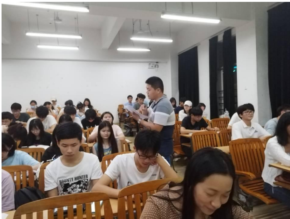
邵晋芳督导深入班级听课