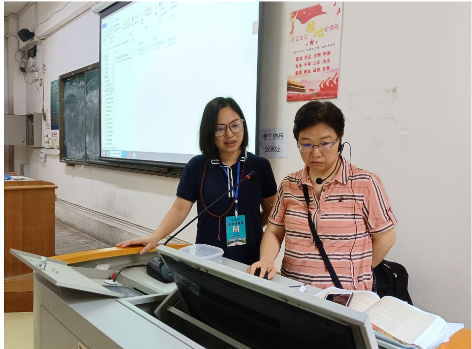
练远媚督导与授课教师进行交流